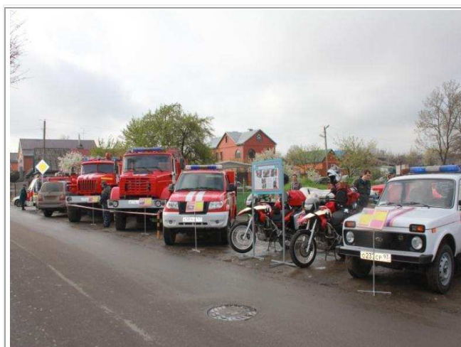
УЧЕБНОЕ МЕСТО № 2 МОУ «Курсы ГО МО город Краснодар»