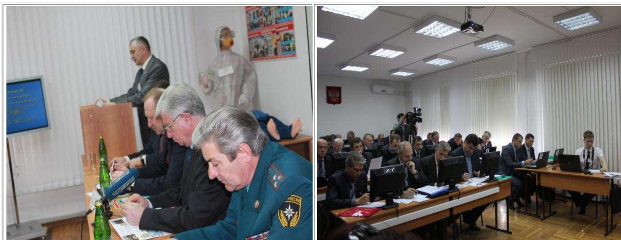
УЧЕБНОЕ МЕСТО № 3 МУ ПАСС «Служба спасения МО город Краснодар АСО № 2